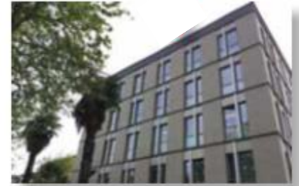
MedAmerican Ambulatory Care Surgery Center