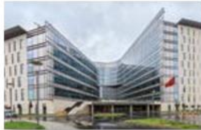
Koç University Hospital